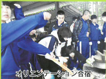
オリエンテーション合宿