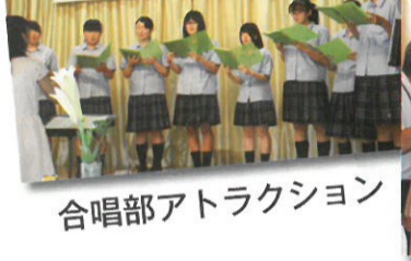
合唱部アトラクション