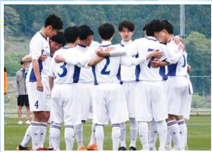
どんな作戦で行こうかな…