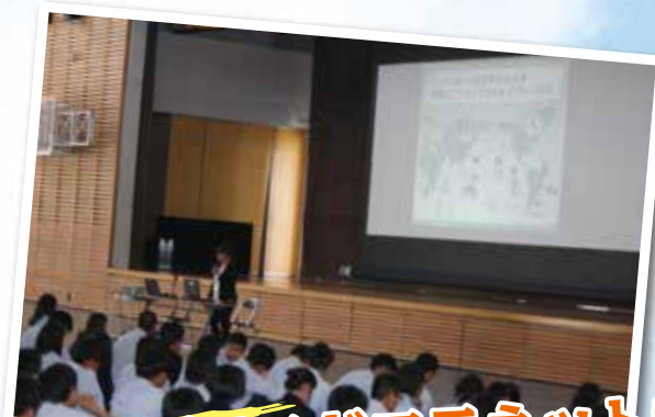
みやぎポリスドコモネット教室