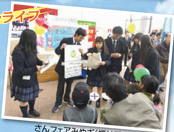
さんフェアみやぎ(福祉系列)