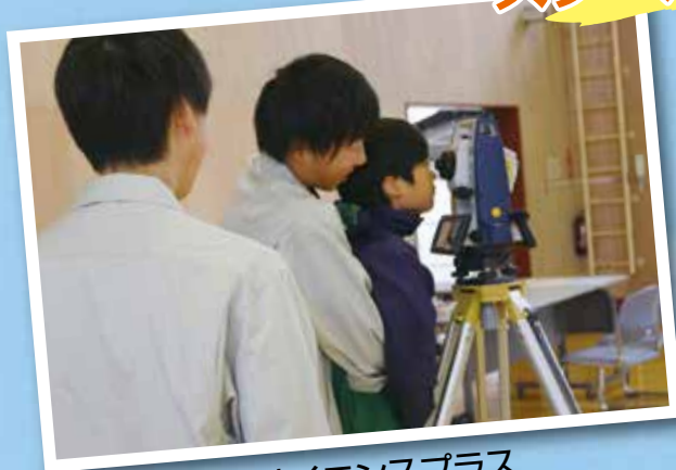
サイエンスプラス