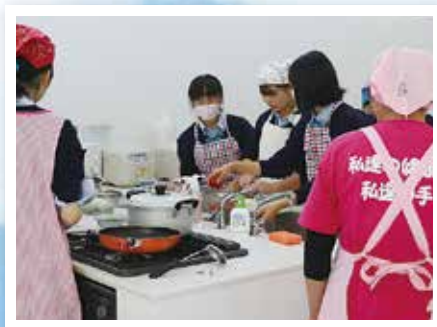
おいしく出来たかな?